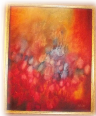
V očekávání; olej, plátno;