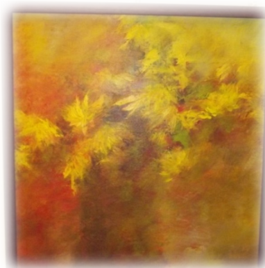
Letní kytice, akryl, plátno;